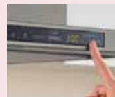
キッチンタイマー