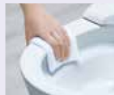
セフィオンテクト