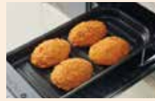
便利なオートグリル機能