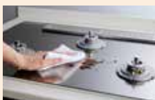
親水アクアコート