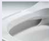
トリプル汚れガード