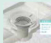
お掃除ラクラク排水口

※①ユニットバスは、同サイズかつユニットバスからの交換を想定しています。②既存の給排水管・ガス管・電気配線が使用でき、設備機器の位置変更はしない場合の価格です。③標準工事費は解体工事・取付工事を含みます。床、壁・天井等、内装工事費用は含まれておりません。(別途必要となります。)④既存の給排水工事を再利用の価格になります。⑤現地調査、工事場所により追加費用が必要になる場合がございます。※在来浴室の場合は別途対応になります。