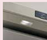
照明の調光・調色