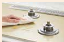
親水アクアコート