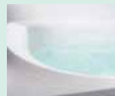
お掃除ラクラク人大浴槽