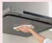
汚れ落としも簡単