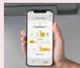
専用アプリで操作可能