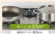
同時調理もスマートに