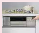
コンロと自動連動