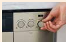
13段階の火力微調節機能