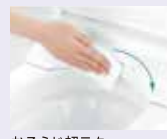
おそうじ超ラク フチなしウォッシュレット